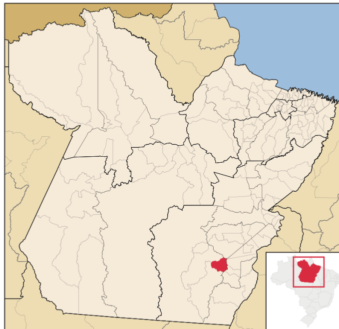
Figura 1 – Localização do Município.