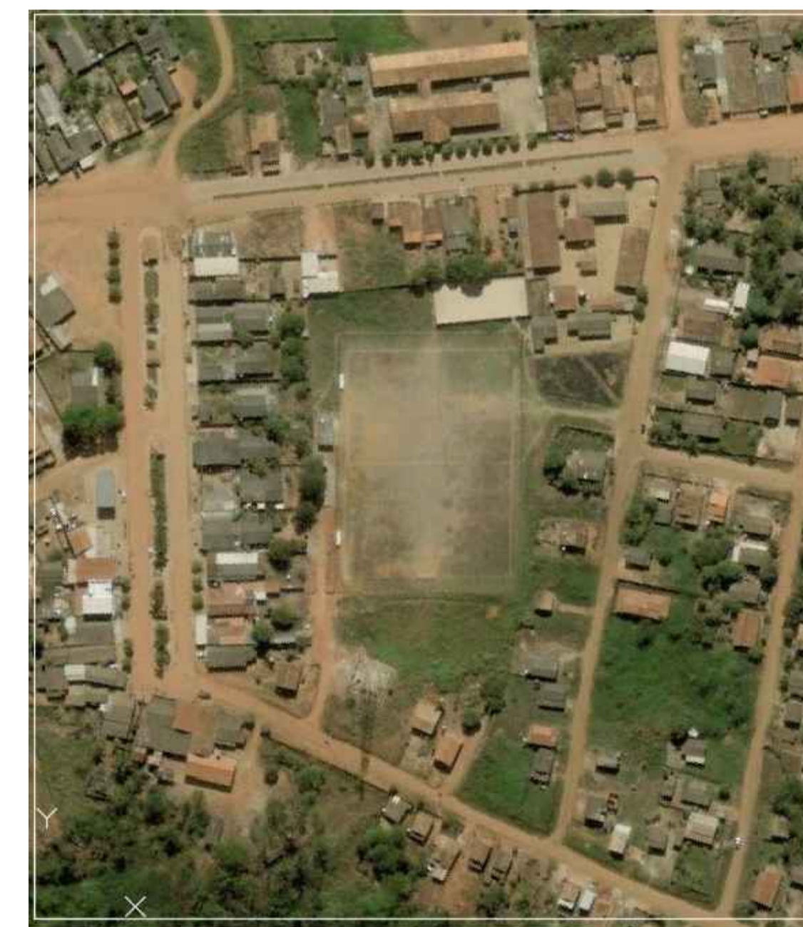
IMAGEM DE SATÉLITE DO LEVANTAMENTO PLANIALTIMÉTRICO TOPOGRÁFICO SEM ESCALA