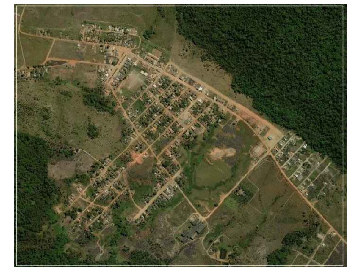
IMAGEM DE SATÉLITE DA SITUAÇÃO GERAL SEM ESCALA