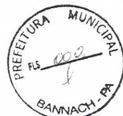
Lucineia Alves da Silva Oliveira Prefeita Municipal de Bannach

3.1. Este Convênio tem por objeto o restabelecimento de trafegabilidade em áreas atingidas por desastres naturais, no município de Bannach, estabelecimento de cooperação mútua entre os partícipes, visando à implementação dos objetivos de interesse comum das partes.